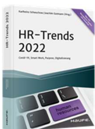
HR-Trends 2022 ISBN 978-3-648-15293-5 € 109,00 [D]

Von den Herausgebern sind auch folgende Titel erhältlich: